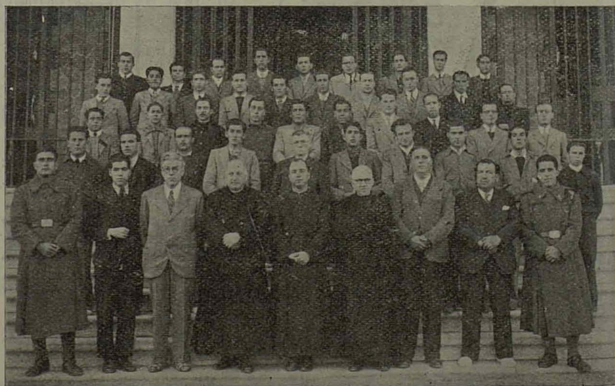
Llorens centra su resurgir en la práctica de los Ejercicios Espirituales. La última tanda en Sarriá.